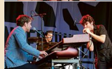
Walt's Blues Box feat. The Upperclass Windmachine Aadorf