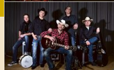
The NadaCowboys Winterthur